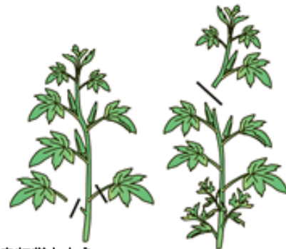
果実を収穫したら その下方の葉は摘み取る

追肥 翌年1月下旬~2月上旬に1回目の 追肥をしましょう。マルチ穴にまき、水をまきま す。2回目の追肥は3月中旬~下旬にします。1 回目同様に行ってください。