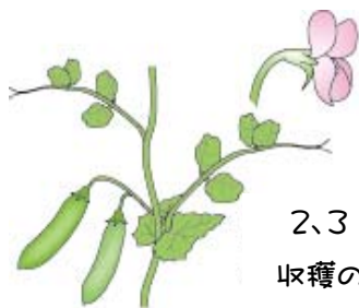
2、3日おきが収穫の目安です